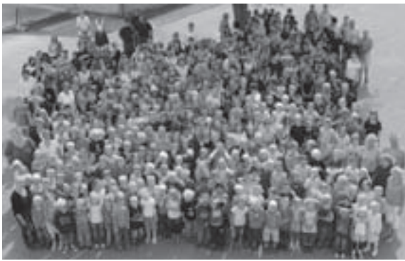
Eleverne i den nuværende samlingssal - skolegården ...