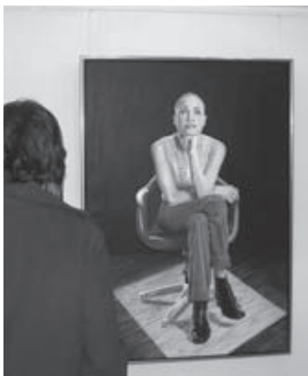
Ritt kigger på gæsterne til ferniserigen